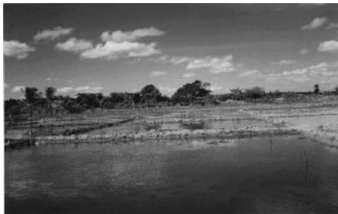
Figura 2. Lavagem do solo

parcelas construíram-se diques de contenção de água, para a aplicação da lâmina de água; a incorporação dos produtos gesso, esterco de curral e casca de arroz foi manual, tendo-se o cuidado de incorporá-los uniformemente no interior das parcelas, enquanto na parcela destinada ao tratamento com vinhaça colocou-se, inicialmente, uma lâmina de água de aproximadamente 5 cm e, em seguida, fez-se a aplicação do produto. Posteriormente, provocou-se turbulência na mistura, a fim de possibilitar uma uniformização melhor da mesma. Durante 40 dias, fez-se a lavagem do solo, mantendo uma lâmina de água de 8 cm na sua superfície (Figura 2).