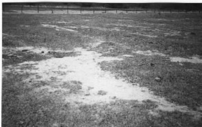
Figura 1. Aspectos gerais do solo da área experimental

As operações de implantação do experimento compreenderam o nivelamento do terreno, uma aração na profundidade de 30 cm e duas gradagens niveladoras, visando facilitar as irrigações e manter a uniformidade da lâmina de água. Também, foram providenciados a limpeza e o aprofundamento dos drenos coletores, a aproximadamente 1,2 m, situados a uma distância de 50 m no sentido norte e 75 m no sentido oeste. Em torno das